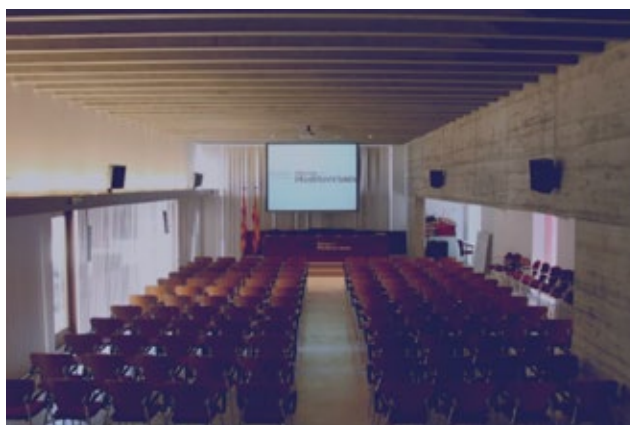
Museu de la Mediterrània