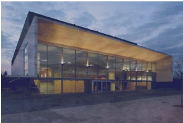
Auditori Espai Ter