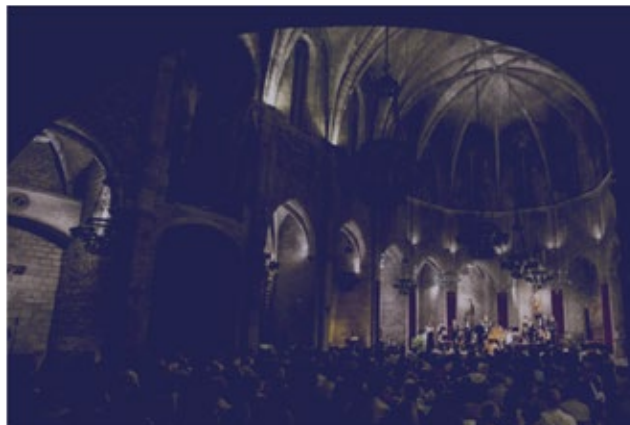
Església de Sant Genís