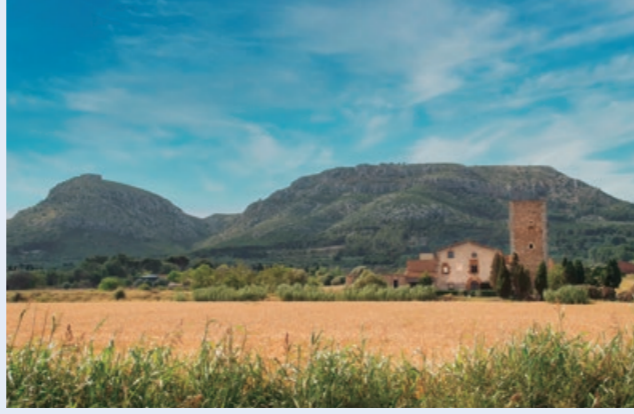
Torre Bagura. Torre Bagura.