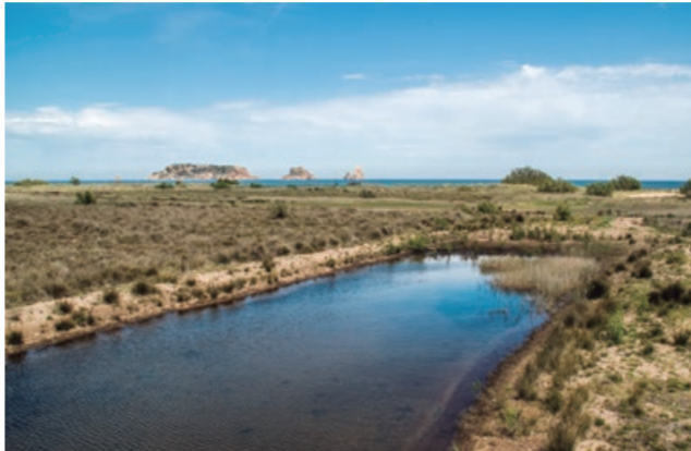
La Pletera. La Pletera.

Itineraris en bicicleta Itinerarios en bicicleta