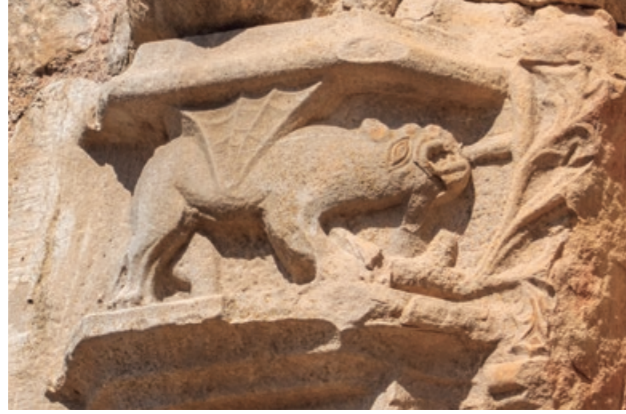
Església de St. Feliu de Boada. Iglesia de St. Feliu de Boada.