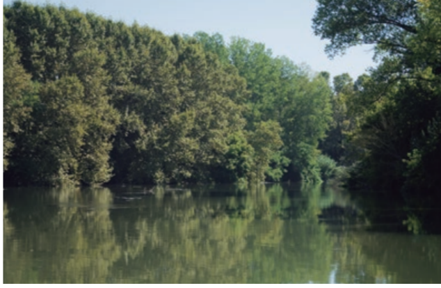
El riu Ter. El río Ter.