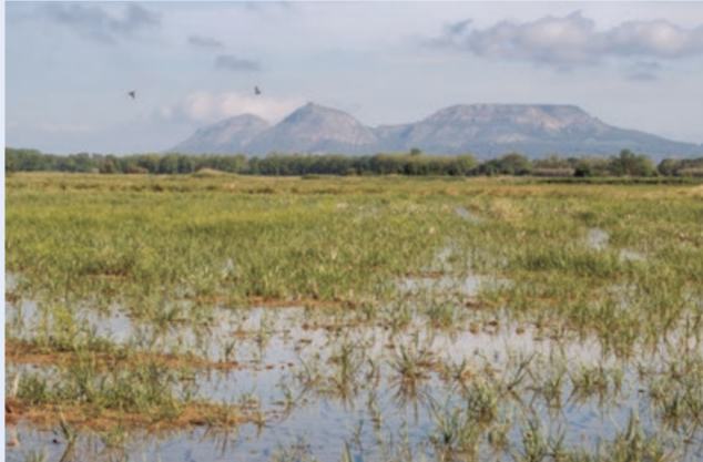
Arrossars de Pals. Arrozales de Pals.