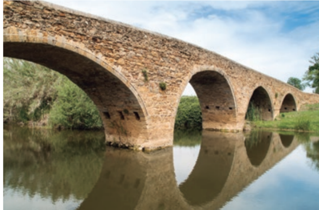
El pont sobre el Darò. El puente sobre el Darò.